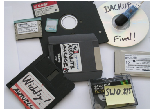
Datensicherung - oft unterbewertet im Maschinenumfeld

Was im EDV-Umfeld mit Serveranbindung durch automatische Sicherungen wie von Geisterhand regelmäßig und zuverlässig erfolgt, ist im Maschinenumfeld noch echte Handarbeit. Die Steuerungen der Maschinen und Anlagen haben die unterschiedlichsten Betriebssysteme und Speicherarchitekturen. Der Anwender bzw. Betreiber ist oft nicht im Besitz der entsprechenden Sicherungsprogramme . In den seltensten Fällen ist eine Datensicherung im Lieferumfang enthalten. Beim Ausfall der entsprechenden Komponenten geht dann wertvolle Zeit zur Wiederbeschaffung oder Rekonstruktion der Software verloren. Eine rechtzeitige Datensicherung und die richtige Strategie für Aufbewahrung und Aktualisierung der Daten und Programme sichert die Produktivität Ihrer Anlagen und die Liefertreue für Ihre Kunden. Wir unterstützen Sie gerne dabei !